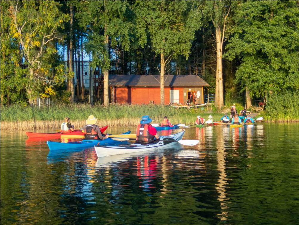
Viikkomelonnasta palataan ilta-aurinkon valaisemalle vajalle.

Vajan päiväkirjaan on merkitty 1826 kertaa lähtöjä. Luku on suuntaa antava. Melottuja kilometrejä oli yhteensä 34 442 km.